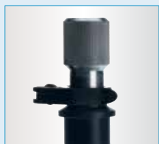
Zapfenaufnahmeinheit mit Schnellspanner zur Arretierung ohne Werkzeug