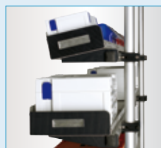
Regalböden in unterschiedlichen Tiefen und Breiten erhältlich, sowie Neigung über Dreiecksträger möglich