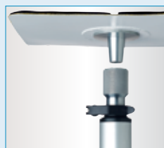
Adaption am Fahrzeugdach über selbstklebenden Flausch, Klettmatte mit Zapfen, Distanzrohr und Zapfenaufnahmeinheit